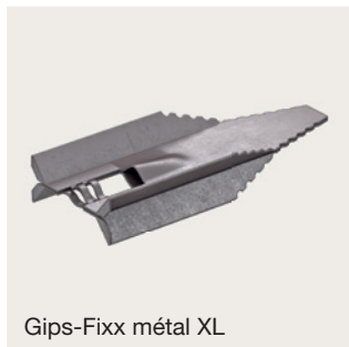
Gips-Fixx métal XL