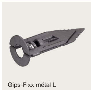
Gips-Fixx métal L